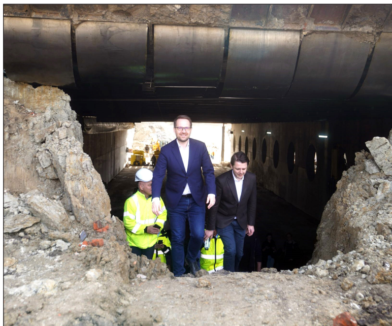
A polgármester és csapata sikeresen átkeltek a vasúti aluljárón

A Solventul vasúti aluljáró összeköti az Állomás utcáját és a Bogdăneștilor utat, mindkét irányban kétsávos út, dupla villamosvonal, járdák és kerékpárutak lesznek benne. A munkafolyamat következő szakaszában megépítik az aluljáró rámpáit. Optimista becslések szerint az új vasúti aluljárót még idén nyáron átadják a közúti forgalomnak, de a villamosközlekedés elindítására még évekig kell várni.