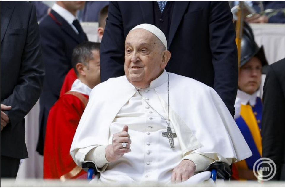
Ferenc pápa a virágvasárnapi szentmise végén a vatikáni Szent Péter téren 2025. április 13-án

A Vatikán hírcsatornája azt is közölte, hogy 2024 áprilisában Ferenc pápa jóváhagyta a pápai temetési szertartások liturgikus könyvének frissített kiadását, amely majd irányt ad a megtartandó temetési szentmisének. A második ki-